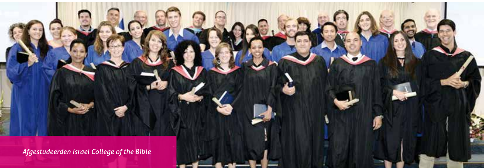
Afgestudeerden Israel College of the Bible

Postell: "Voor studenten die niet in Israël wonen, is er het 'Jaar in Israël Programma'. Dat is een zeer professionele opleiding op BA- en MA-niveau. Je komt een heel jaar Messiaans-Joodse Studies studeren en verblijft intern op de ICB-campus. Je kunt ook één enkel